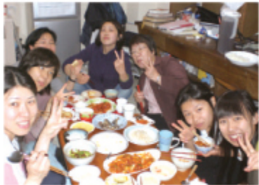
女子寮の食事会での交わり