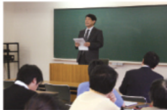
神学の学びの一端に触れる、 青年の集いの模擬授業

献身を考えている若い世代を対象に、毎年9月の第4土曜日に開催される集い。開会礼拝に始まり、さまざまなテーマによる分団でのディスカッション、模擬授業、先輩伝道者の「証し」などがあり、神学校生活の一端を体験することができる。