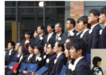
伝道者として旅立つ卒業式

毎年1月、全国から集まる教職者（牧師、伝道師）と修了直前の神学生らが、3日間寝食を共にしながら、一主題のもとで講演やシンポジウム、分団などのプログラムを通して今日の教会の課題を神学的に話し合う。卒業後の貴重な再研修の機会であり、日本基督教団以外の教職者も参加可能。