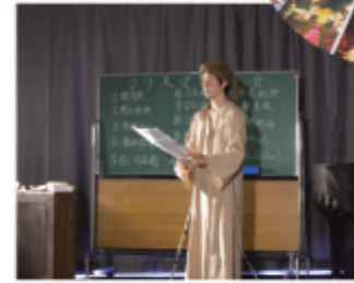
学生会によるクリスマス愛餐会の風景