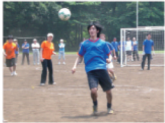
クラスが一致団結する運動会

東京神学大学の緑豊かなキャンパスは活気に満ちています。講義は徹底した少人数制で、学生と教員は互いに真剣な議論を交わします。また、学生会が中心になって毎日のチャペル礼拝、春の運動会、秋の全学修養会、クリスマス祝会などが行われます。学生の年齢層は10代から70代までと幅広く、入学前の社会経験、出身教派も多様。互いに切磋琢磨しながら学んでいます。