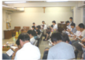
夏期伝道実習に向かう神学生を 祈りで励まし送り出す杜行祈禱会