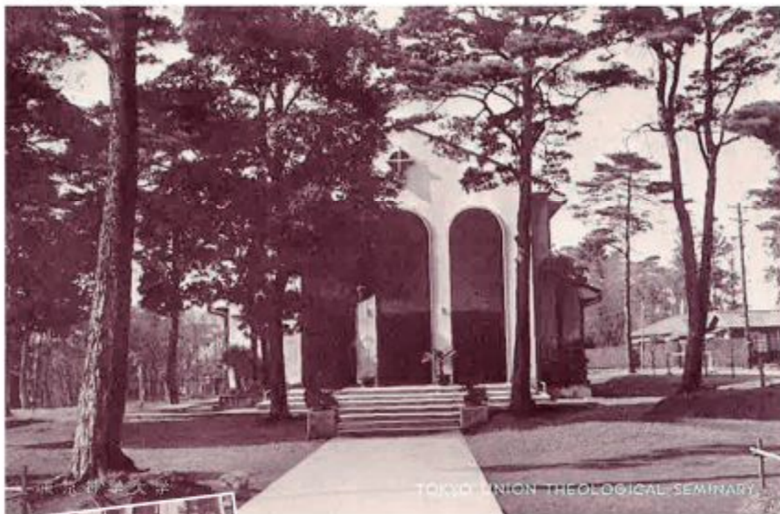
TOKYO UNION THEOLOGICAL SEMINARY