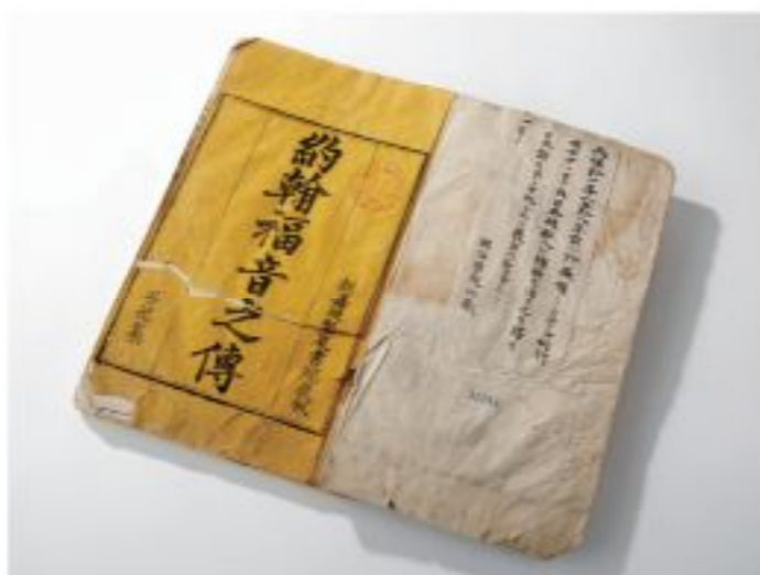
ギュツラフ訳ヨハネ伝

以来、聖書と歴史的な信仰告白の資産を継承し、「教団信仰告白」を規準とした、健全な福音の伝道と諸教会に開かれた神学教育、教団形成の更なるジャンプに努める神学大学——これが本学の基本姿勢です。