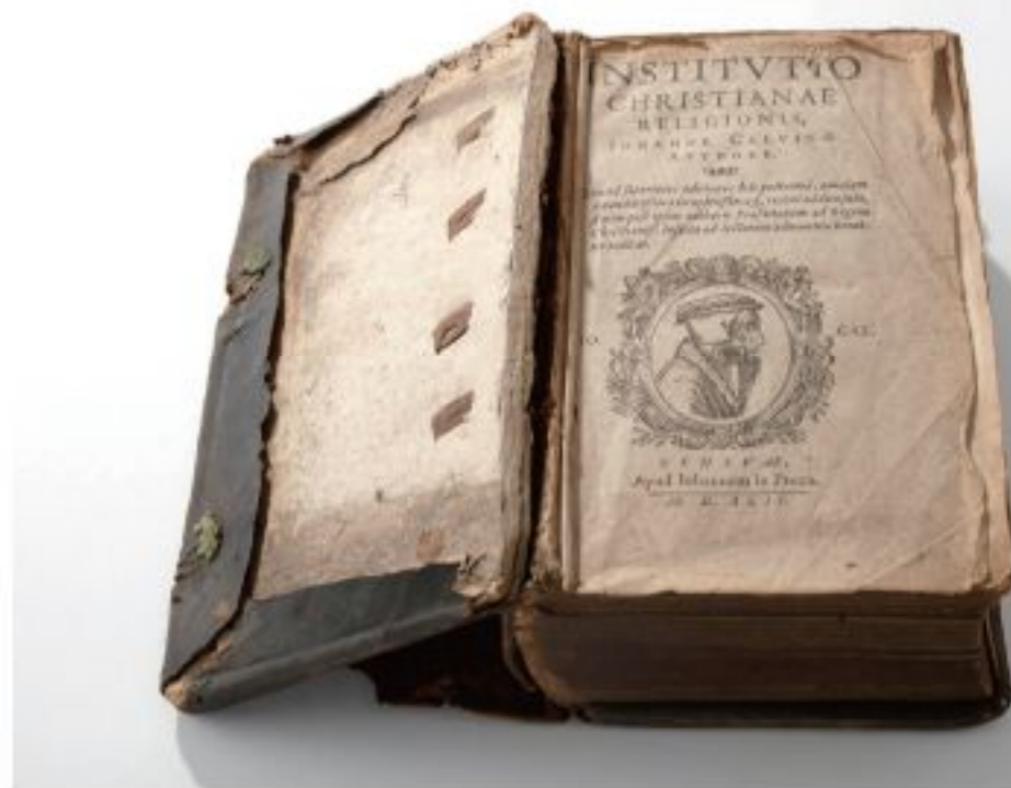
カルヴァンの『キリスト教綱要』 ジュネーブ