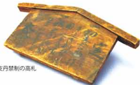
切支丹禁制の高札

以来、聖書と歴史的な信仰告白の資産を継承し、「教団信仰告白」を規準とした、健全な福音の伝道と諸教会に開かれた神学教育、教団形成の更なるジャンプに努める神学大学——これが本学の基本姿勢です。