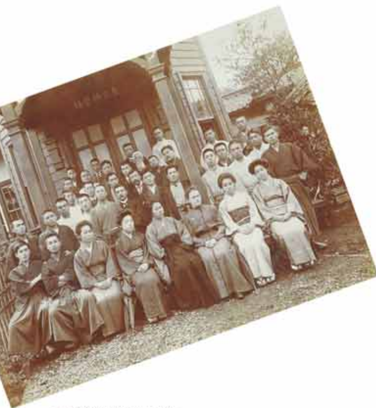
東京神学社の学生と教師

「日本の教会と神学校はなぜ合同したがるのですか？」これは十年ほど前本学を訪問した韓国の一神学大学の学生たちが、本学に合流した多様な旧教派神学校の系統図を見て発した驚きの問いです。一つの答えは様々な教会合同運動（エキュメニズム）を主動機とし、教派を建設する動機も絡み織りなすドラマ——これが歴史的に見た日本伝道のシナリオと言えましょう。