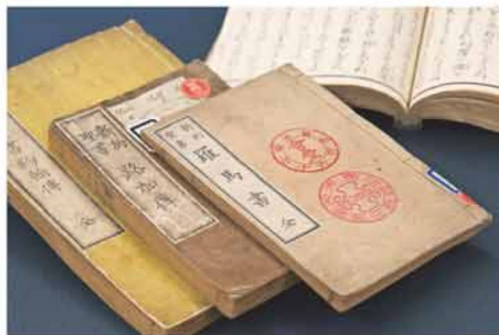
ヘボン訳聖書 (ルカ伝、ヨハネ伝、ローマ書)

1850 1860 1870 1880 1890 1900 1910 1920 1930 1940 1950 1960 1970 1980 1990 2000 2010 2020